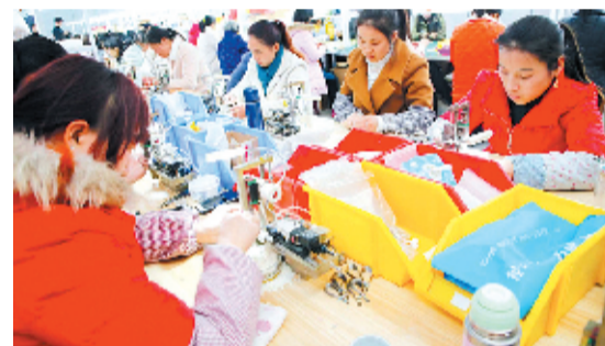
家门口的扶贫车间