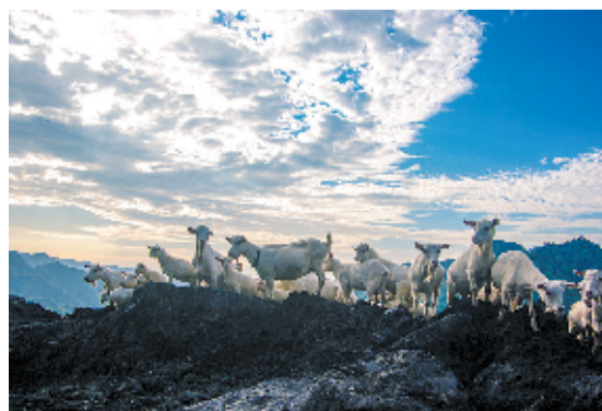
规模养殖马头山羊