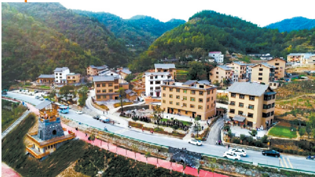
全国文明村观音镇龙桥村