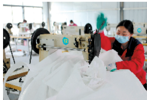
扶贫车间就近务工