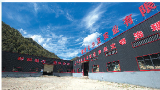
湖北七夕艾实业有限公司一角