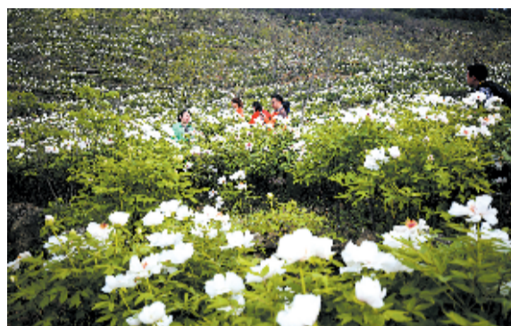
牡丹基地吸引游客赏花

脱贫攻坚是实施乡村振兴的重要基础，乡村振兴是稳定脱贫攻坚成果的有效保障。2020年是脱贫攻坚决战决胜之年，也是脱贫攻坚与乡村振兴交汇期和衔接期。脱贫攻坚如何有效对接乡村振兴？郧西县抢抓机遇，独辟蹊径，走出了一条“企业回迁兴业、能人回乡反哺”的新路子，有效增强了农村改革发展的动力与活力。