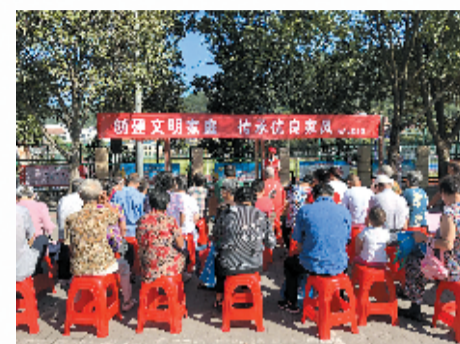
家风家训活动营造文明氛围