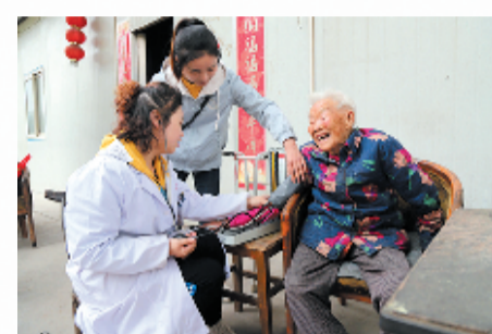
志愿者上门为老人义诊