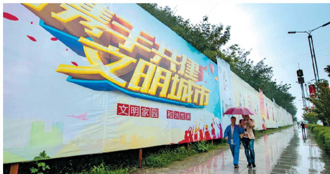
大街小巷构筑文明风景