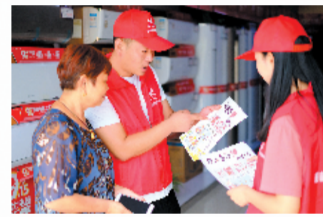
志愿者向商户宣传移风易俗