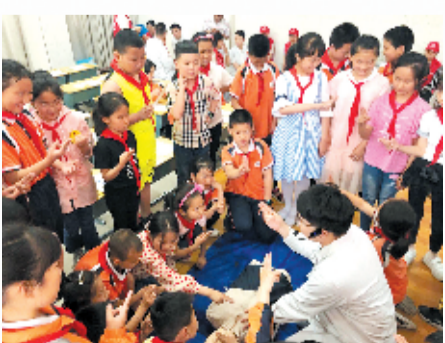
与留守儿童共同开展“欢庆六一，与爱同行”志愿服务活动