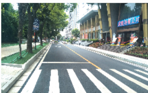
改造后的神龙街干净整洁