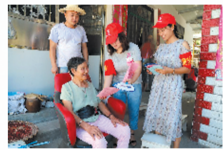
进村入户宣传文明创建知识