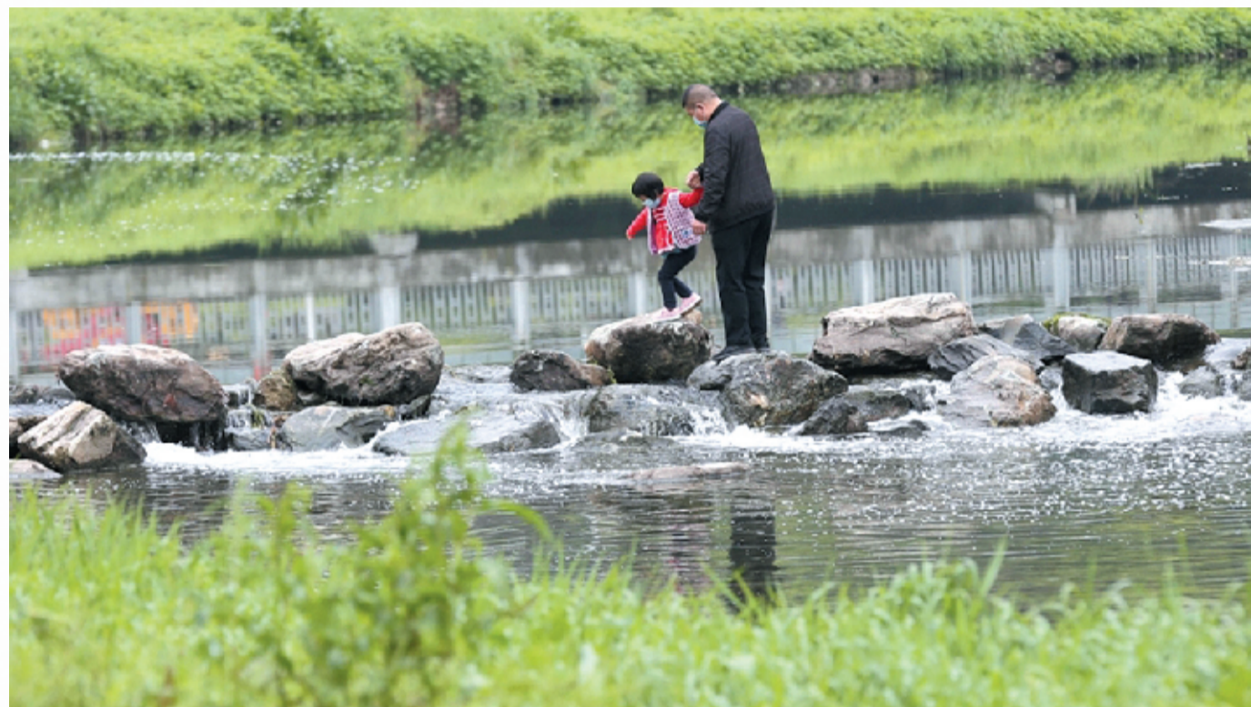
治理后的神定河水清、岸绿、景美

一条河，清流如烟，芳草如茵。爷孙俩在波光中漫步，只留下欢笑和脚印。在看风景人眼中，他们也是一道亮丽的风景。