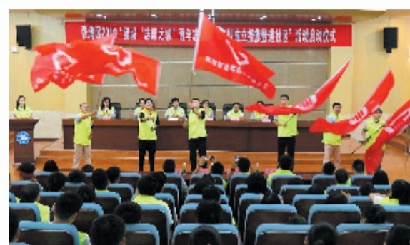
张湾区成立“青年志愿服务队”