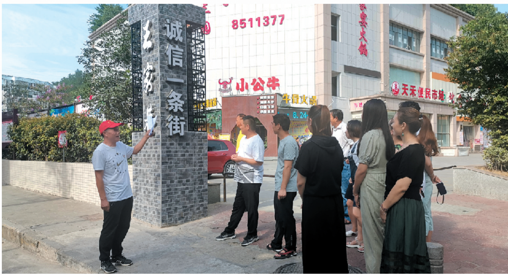
组织辖区商户在王家巷“诚信一条街”开展诚信教育活动