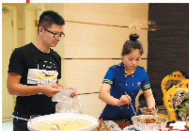
餐后打包杜绝浪费已成许多市民的习惯

市市场监管局、市商务局有关负责人介绍,今后我市将继续通过各大媒体平台、微信公众号持续进行广泛宣传,向社会各界发出“厉行勤俭节约,反对餐饮浪费”倡议,进一步引导全社会形成“节约光荣,浪费可耻”的思想共识;指导市餐饮行业协会、工会制定《遏制餐饮浪费行业公约》,加强行业自律;联合相关部门对餐饮企业“厉行节约、反对浪费”落实情况进行实地走访、检查,并将情况及时向全社会通报;引导餐饮企业创新服务方式,积极推行“分餐制、公筷制、双筷制”,推广“N-1”点餐模式,科学合理设计宴会菜单,调整菜品数量、份量,带头不使用一次性餐具,提供环保打包服务;对有效减少餐厨废弃物的餐饮企业,以及在食品采购、储运和加工等环节厉行节约的单位和个人进行表彰和奖励,建立健全“厉行节约、反对浪费”的长效管理机制。