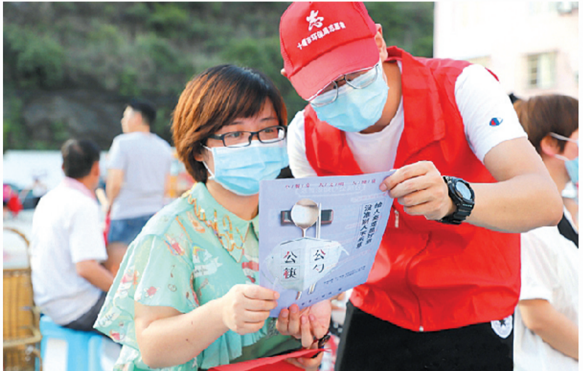
与文明握手,倡导“公筷公勺”

“您可以在宣传栏上签名,如果菜吃完或者打包,可以享受满100元减10元的优惠。”每天中午,十堰城区“粗