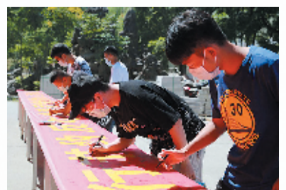
签名践行“厉行节约 反对浪费”理念