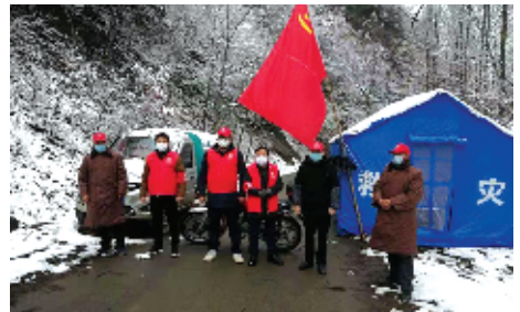
车城高中帮扶干部在疫情防控卡点值守

此外,扶贫工作队还积极与市、区交通运输局对接,争取政策和资金,为秦家坪村修建通村达院路。当地村民告诉记者,路修通后,村里的农副产品销路更“广”了,增收的路子越来越宽,他们的生活也越来越好了。