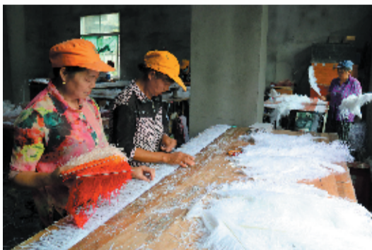
贫困户在扶贫车间加工羽毛制品