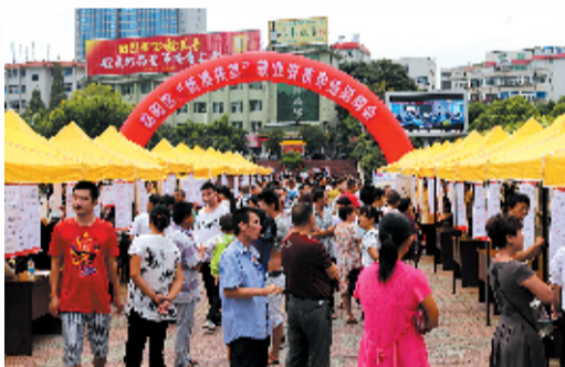
举办精准扶贫招聘会