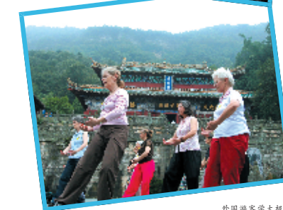
外国游客学太极拳