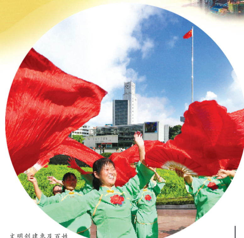
文明创建惠及百姓

第一时间成立市新冠肺炎疫情防控工作指挥部,制定《关于全力以赴坚决打赢我市新冠肺炎疫情防控工作阻击战实施意见》等文件,自上而下构建“指挥—指导—统筹协调”的应急指挥体系。启动“战时”机制,压实各方责任,群策群力,全面筑牢城市输入、防输出、防反弹。全市8.9万名党员干群,4180名驻村帮扶工作队队员,5500多名志愿者,6.7万多名志愿者下沉一线,守牢社区(村)、守牢车站、商场等公共区域,守牢福利院、养老院、看守所等特殊场所,守牢119个离堰堰区通道,让党旗在防控一线高高飘扬;不惜代价救治患者、拯救生命,全市10075名医护人员、3999名卫生防疫人员和672名广济堰堰区医护人员全力参与救治防控。全市累计确诊病例172人,治愈率98.81%,死亡率1.2%,在全省市州中治愈率最高、死亡率最低。