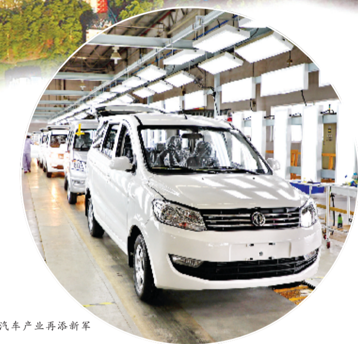
汽车产业再添新军

通过深化改革,打破各种各样的“卷帘门”“玻璃门”“旋转门”,打通企业发展的痛点、难点、堵点,不断完善“互联网+政务服务”平台,推动政务信息互联互通,推动“最多跑一次”改革落地生根,不断提升群众办事的便捷度。出台《关于更大力度优化营商环境激发市场活力的工作措施》,弘扬“店小二”精神,构建亲清新型政商关系,致力把十堰打造成为全省办事效率高、投资环境优、综合成本低、企业获得感强的示范城市。在全省首推企业开办“2半0”标准,累计为企业减免税费超过40亿元。与青岛、海口等9市共获“营商环境质量十佳城市”称号。