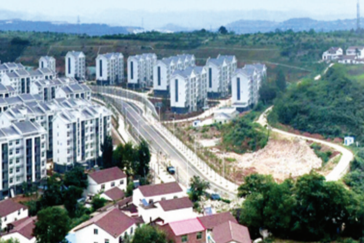
易地搬迁 幸福安居