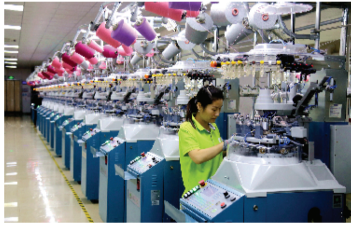
袜子工厂 带动就业