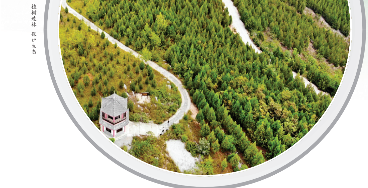
植树造林 保护生态