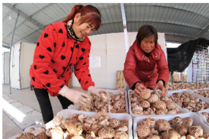
香菇产业 助力增收