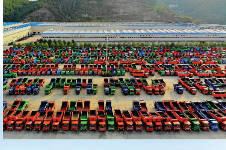
工业经济 提质增效