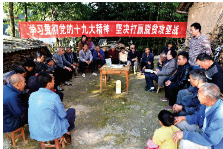
党建引领 凝聚基石