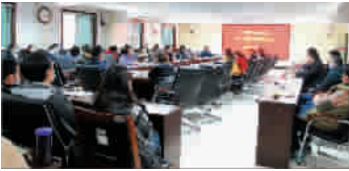
市中心血站全体党员干部职工参加轮训

本报通讯员李琳报道:3月8日,市中心血站启动2021年春季党员轮训和干部培训,进一步强化党员理论武装,打造一支信念过硬、政治过硬、责任过硬、能力过硬、作风过硬的供血干部队伍。