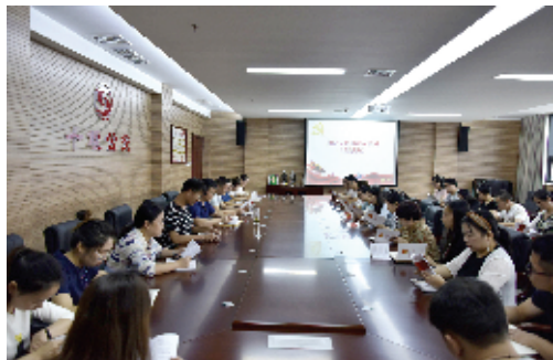
市城市公交集团有限公司召开专题会议学习监察法

为实现党规党纪和国家监察法宣传教育全覆盖,进一步深入人心,着力构筑“不敢腐、不想腐”的堤坝,市城市公交集团有限公司(以下简称十堰公交)始终坚持以“十进十建”活动作为一项基础性工作来抓,结合企业实际,延伸宣传触角,强化阵地建设,以滴水精灌式的举措扎实推进党规党纪和国家监察法宣传教育落到实处,驰而不息、久久为功,为推进全面从严治党向纵深发展营造良好氛围。