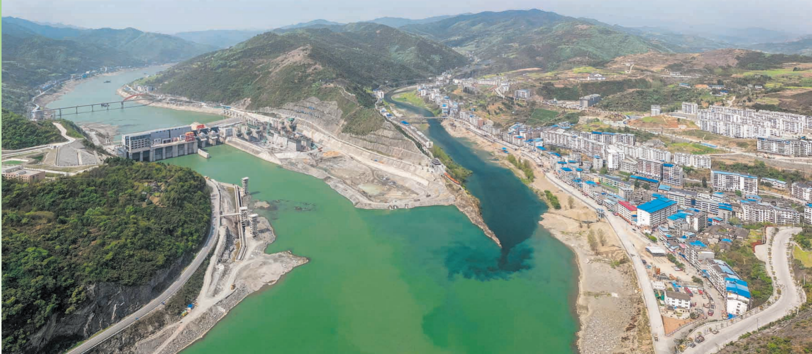
郧西县夹河关水电站