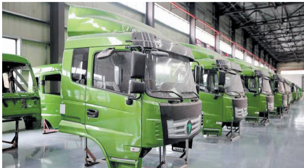
天道新能源汽车生产线