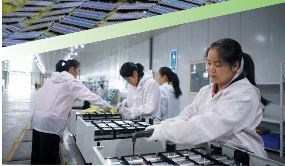
猛狮锂电池生产线

“十三五”期间,在一大批重大项目的有力推动下,郧西县新能源产业已形成从研发到装备制造、产业化生产、推广应用“一条龙”模式。该县新建的夹河关水电站,孤山航电枢纽8台机组发电运行,河夹来家河等118个总装机22万千瓦的光伏发电站全部并网。随着集群式发展步伐不断加快,郧西县新能源产业将迎来更大的发展空间。2020年,郧西县域经济综合排名在全省31个三类县(市、区)中,由2015年的末位前进到第14位,累计前进17个位次。