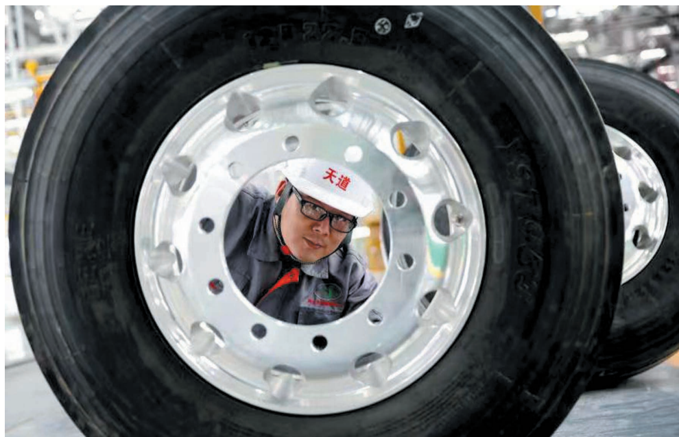
工人对轮胎进行质检