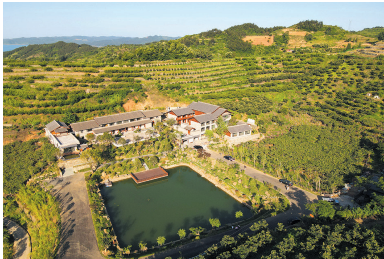
山居民宿道隐仙居

近年来,武当山特区以群众老旧房屋进行改造为抓手,大力发展民宿产业,培育形成了隐仙别院、太和紫隐、福地居、灵山居、本来民宿、大岳原宿等养生文化主题酒店。元和观、龙王沟、寨沟、鲁家寨等村200多户居民积极开展民居改造,依托武术习练、健康养生、道文化体验等内容,大力发展民宿经济。