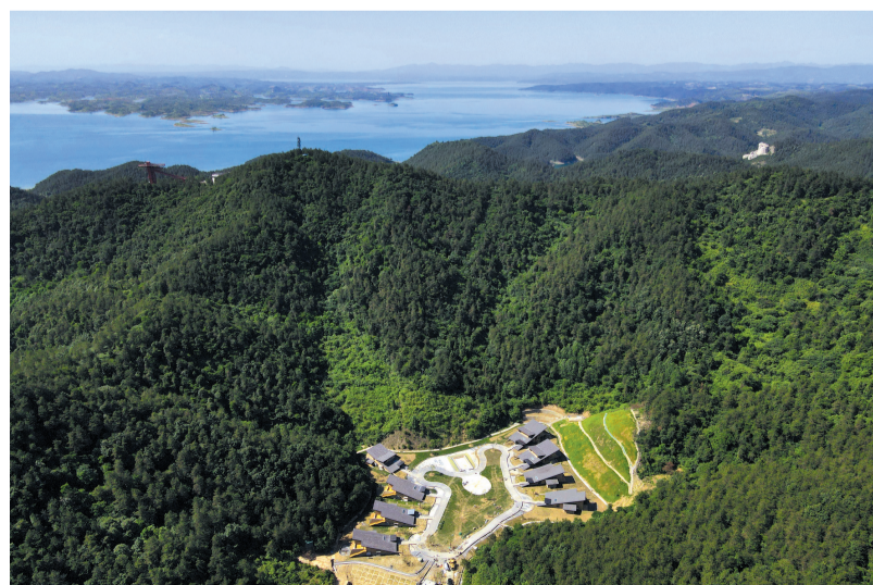
高端民宿隐居山里