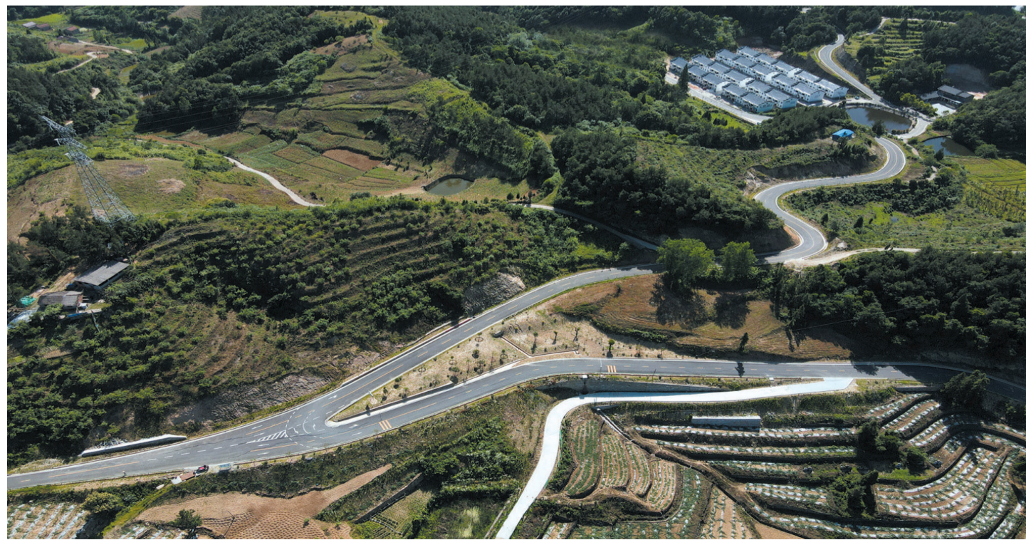
通村公路四通八达

百尺竿头扶摇上,千帆竞发勇者胜。乡村振兴战略实施以来,武当山特区呈现出农业升级、农村进步、农民发展的新图景,农民获得感、幸福感、安全感显著提升。随着乡村振兴战略的持续深入,我们深信,武当山特区的农村发展前景必将更加广阔。