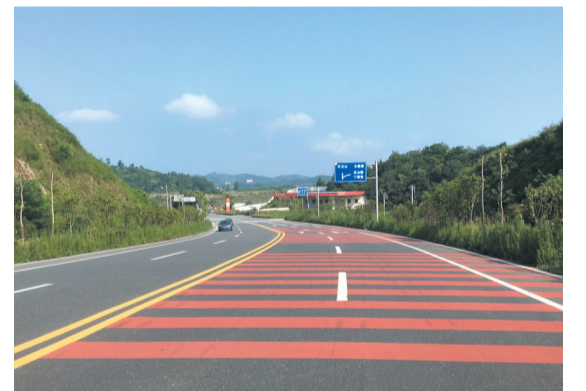
高标准建设的土武一级路