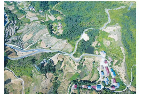
“四好”公路助力乡村振兴

道路通畅,百业兴旺。四通八达、便捷高效的公路网络,为武当山特区高质量发展创造了优良条件。展望未来,特区交通建设将肩负特区腾飞梦想的使命,会以千帆竞渡争风流的姿态,继续开拓崭新的征程,助力特区早日实现“国际旅游胜地、东方康养之都、中华文化重镇”的建设目标。