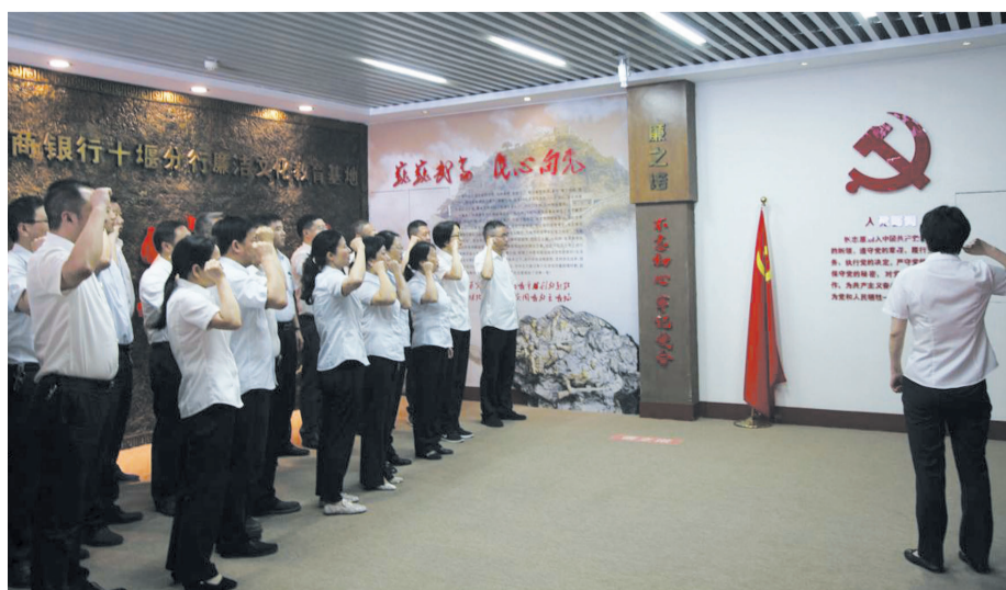
党员在廉洁教育基地重温入党誓词。