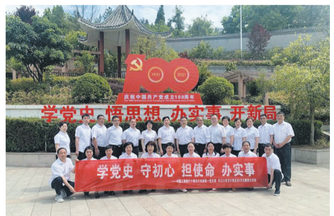
工行丹江口支行党总支与工行十堰分行本部第一党支部组织党员赴丹江口市革命历史纪念馆、丹江口金岗山烈士陵园,开展“学党史 守初心 担使命 办实事”主题党日活动。

业部聚焦服务品质提升,以专业一流的团队,努力建设“您身边的银行、可信赖的银行”。营业网点共有23人,有热情有礼的柜员团队,有朝气蓬勃的青年理财经理团队,有经验丰富的中年大堂经理团队,有尽职尽责的现场管理团队,还设立了现役和退役军人优先办理窗口、残损币兑换窗口、爱心服务窗口、文明示范岗和党员示范岗,提供特事特办上门服务,致力于为客户提供更专业高效优质的多元化金融服务。 惟改革者进,惟创新者强,惟改革创新者胜。今年是建党百年,沐浴在党的光辉里,工行十堰分行将坚持传承创新和守正出新,开拓奋进,为打造现代金融企业书写灿烂篇章。