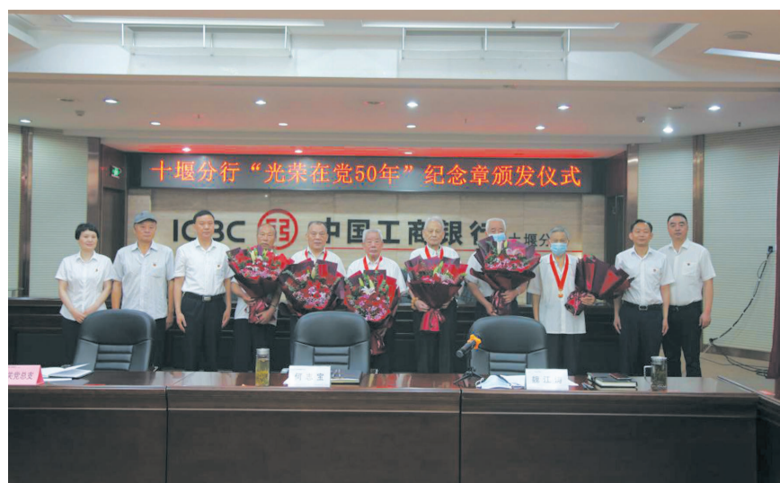
工行十堰分行举行“光荣在党50年”纪念章颁发仪式。