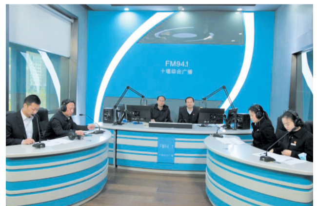
工行十堰分行营业部金融服务团队走进《党风政风》直播间,就听众关切的热点金融问题进行互动。