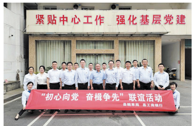
工行竹溪支行、县烟草专卖局联合举办“初心向党 奋楫争先”联谊活动,进一步丰富党史学习教育方式和内容,推进党史学习教育深入开展,激发全体党员干部筑牢信仰之基。