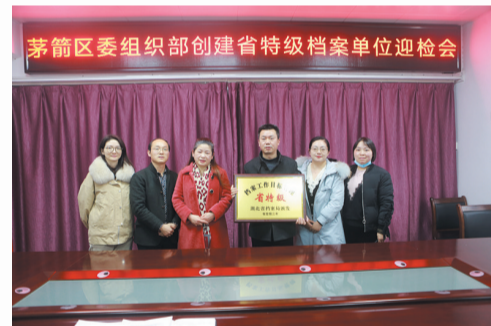
区委组织部实现省特级档案单位创建