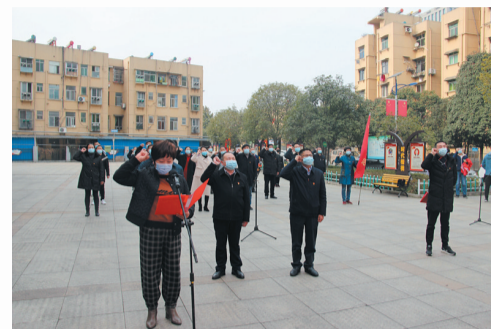
茅箭区举行党员干部志愿服务队授旗宣誓活动

搭建平台育才。打造参政平台，做实人才队伍的政治吸纳，2016年以来共吸纳110余名优秀人才进入全区“两代表一委员”队伍，不断加强党对人才的团结凝聚。在挖掘和