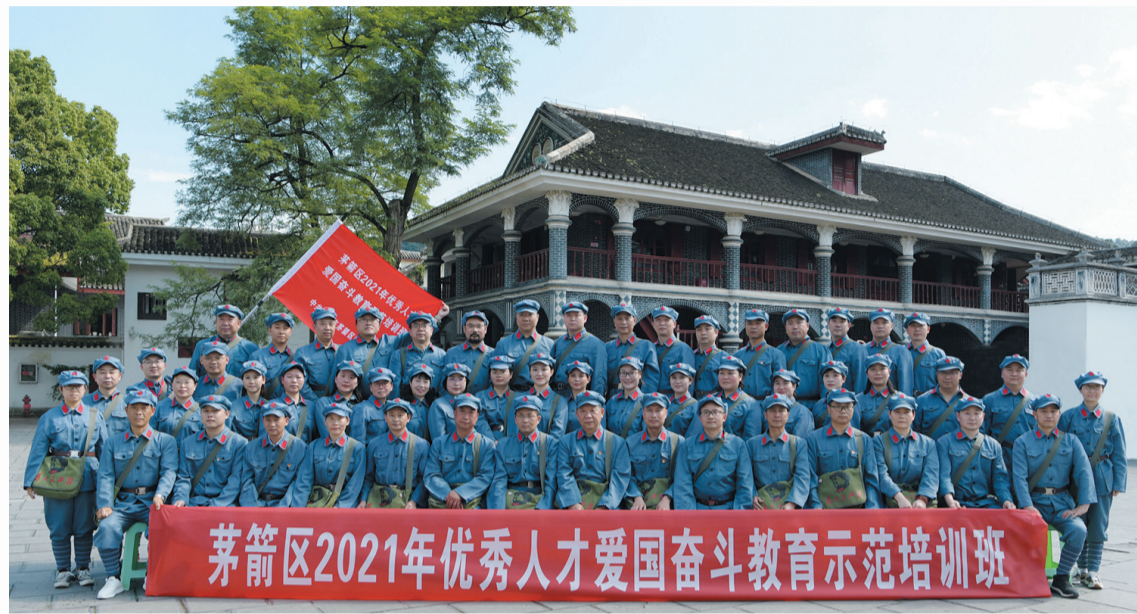
茅箭区在贵州遵义举办优秀人才爱国奋斗教育示范培训班

推进扫黑除恶专项斗争。 提升基层治理能力。在城市创新党建引领基层治理模式，推动750个小区党支部和2480个楼栋党小组建设全覆盖，17364名市区机关党员干部到社区报到，依托“365·有服务”信息系统发布任务4541余条，1.98万人认领接单，织密了“区—街道—社区—小区—楼栋”