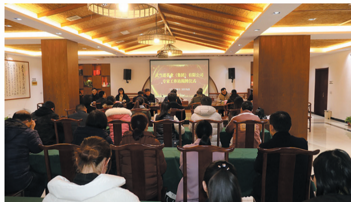
武当道茶业(集团)有限公司专家工作站成立揭牌