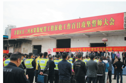
集中调配百余名机关干部进入重大项目一线