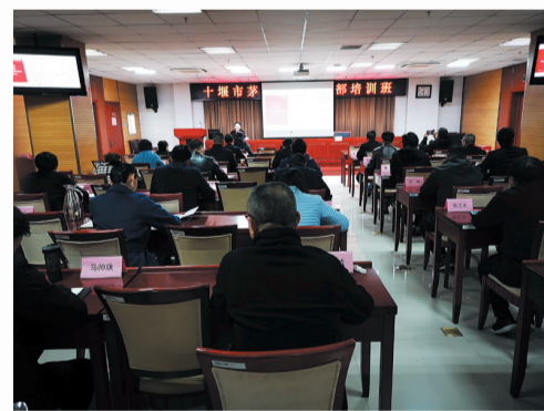
茅箭区在北京市委党校举办党政干部培训