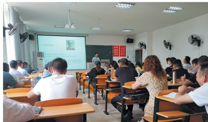
茅箭区村(社区)干部学历提升“百人计划”有序推进