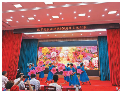
开展庆祝建党百年文艺汇演