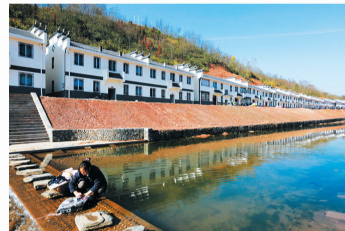
房 温市镇东川村易迁新居