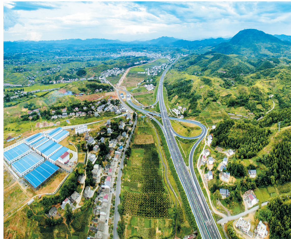
路 竹山谷竹高速穿丰互通