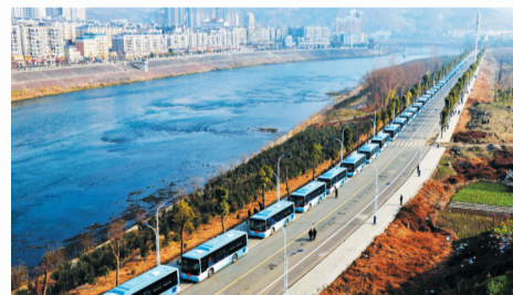
行 竹山城关至擂鼓公交线路开通

人民群众满意度显著提升。稳就业，城镇调查失业率控制在2.93%。社会保险待遇稳步提高，综合参保率达99%以上。城乡低保、特困人员供养、高龄补贴、残疾人补贴等政策全面落实，有效解决农村“三留守”问题。大力发展教育，全县义务教育阶段入学率达100%，竹山一中、县职业技术学校集团学校建成省级示范学校。卫生健康事业长足发展，县医共体建设稳步推进，迁建县妇幼保健院、县中医医院，稳步推进县人民医院内科医技楼及附属工程建设项目。大力发展文化事业，秦巴文化艺术中心投入使用。