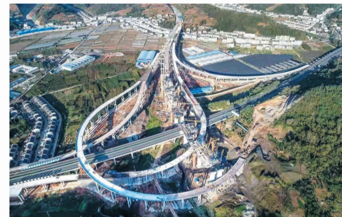
路 建设中的十巫高速