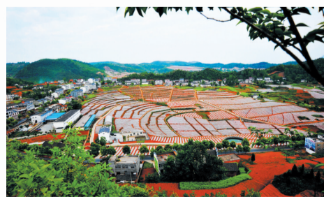
业 产业壮大集体经济