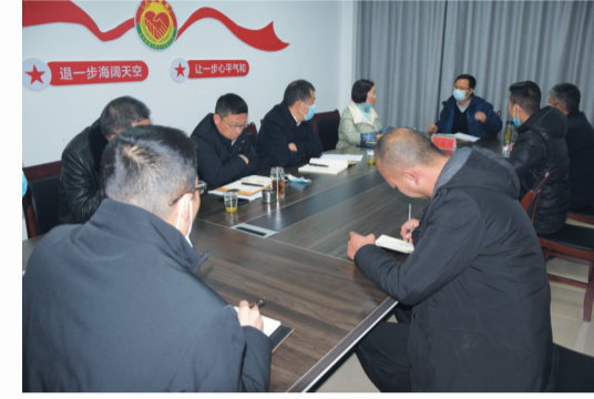
县领导周一直接访