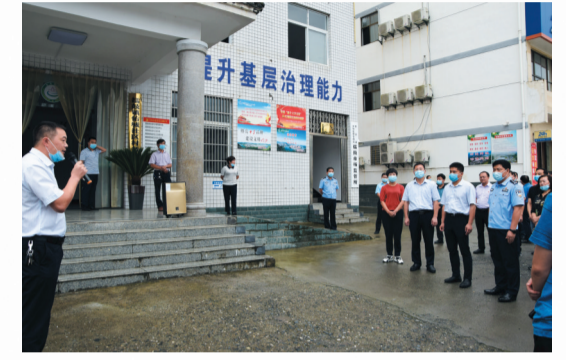
召开全县社会治理现代化建设现场观摩会