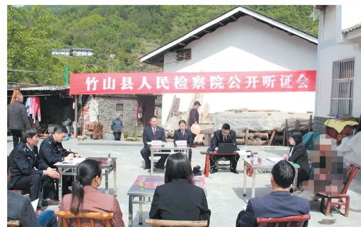
县人民检察院公开听证