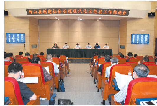
召开社会治理现代化示范工作推进会

为切实消除矛盾纠纷,促进社会和谐,该县健全矛盾纠纷会商联动机制,确保重大矛盾纠纷和疑难信访案件在各部门协同联动下高效化解。推行线上线下同步化解机制,通过“网上问政”“阳光信访”“书记信箱”等载体,多渠道收集民意诉求,及时分流交办;采取视频连线的方式,远程调解矛盾纠纷,在线司法确认,让群众少跑腿、不跑腿也能办成事。将网格员、辅警、专职调解员等人员经费列入年度财政预算,为基层治理提供了人力、物力保障。建立公众参与社会治理奖励机制,营造起人人参与、支持基层治理的良好氛围。