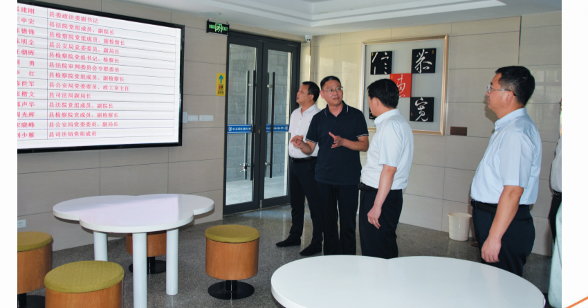
县政法单位班子成员轮流坐班接访