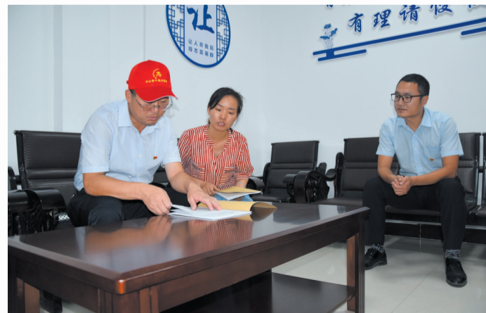
县领导调研督办机关党员干部下沉社区服务情况