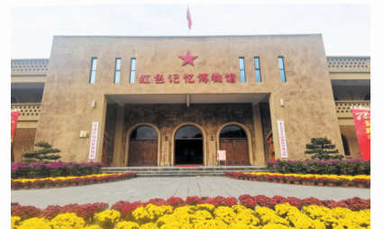
红色记忆博物馆外景

竹溪县红色记忆博物馆是竹溪县廉政教育基地、县青少年爱国主义教育基地。今后，博物馆将继续以继承和传播红色文化为己任，为弘扬红色革命精神、提高人民群众精神文化素养作出应有的贡献。