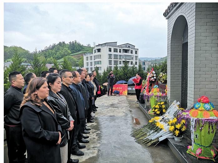
群众在锣鼓洞烈士墓祭奠忠魂