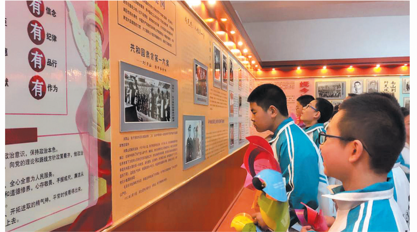
青少年学生在何恐烈士纪念馆参观

队指战员冒着雨雪向指定地点行进，36团的三个营26日清晨5时前到达锣鼓洞山下的狮子包对面的大坪。战斗于早晨5时开始，敌军首先向36团三营阵地发起进攻，接着又向一、二营阵地进攻，企图凭借有利地形阻我西进。由于敌人枪炮密集，我后援部队无法接近锣鼓洞阵地，一连战士在弹药耗尽的情况下，战士们坚强地一次又一次用刺刀、石头对敌敌人，坚持战斗到天黑，共击退敌人十次冲锋。后来接到军区“敌居高临下，加之大雨，补编困难，撤出战斗”的命令后，一连战士才撤至竹山宝丰地区休整。