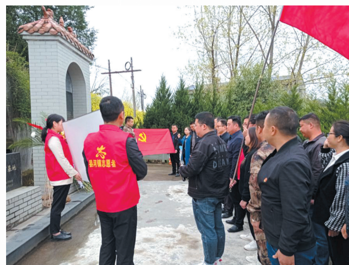
缅怀先烈汲取奋进力量