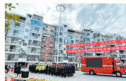
应急安全知识“双进双百”