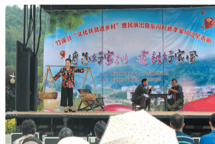
传承好家训，建设好家风