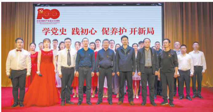
开展党史学习教育活动