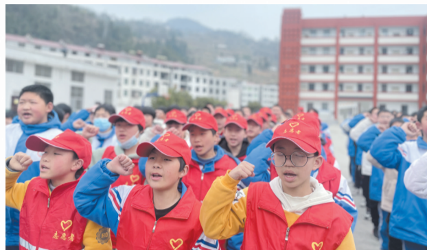
开展“学雷锋·做雷锋”志愿服务

夏日的竹溪县城，大街小巷干净整洁，路旁的文明标语和景观小品新颖夺目，群众文化活动丰富多彩，熙熙攘攘的人群礼让有序……勾勒出一幅美丽生动的文明画卷。