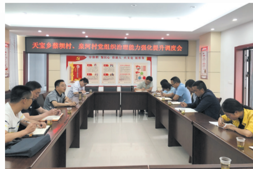
开展村级党组织会