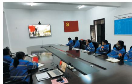
加强理想信念教育