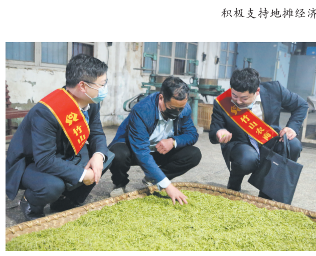
信贷支持茶企茶农

与此同时,竹山农商银行借助物理网点、自助设备、移动支付、银行卡等智慧金融体系,全面优化农村支付结算环境,全面实现金融服务全覆盖体系。截至目前,全县26个营业网点、61处自助银行、246个普惠金融服务站、1436台POS机、12万个手机银行、2.1万个二维码支付的全覆盖金融服务网络,打通了乡村振兴服务的“最后一公里”,实现了业务办理“最多跑一次”,将惠民补贴发放、残零币兑换等业务直达群众身边,让群众足不出户就能享受到贴心服务。