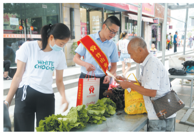
积极支持地摊经济

组织发力,党员带头,携手共建,同甘共苦。竹山农商银行在界岭村开展“整村授信”过程中,注重发挥基层党组织战斗堡垒作用和党员干部先锋模范作用,党员群众一起聊产业、谈乡风、话发展,实现党员干部带头引领村民发展种植养殖业,带动村民一起做做大做强产业,确保村民少走弯路,减少经济损失。同时,通过丰富金融服务,组织金融村官入村开展金融夜校,与村党支部联合采取金融知识、夜校文化进村组等形式,传播红色文化、宣讲金融政策,提供致富创业信息,丰富农村文化生活,累计开展各类宣讲、文化下乡活动30余次,受众人数达1000余人。