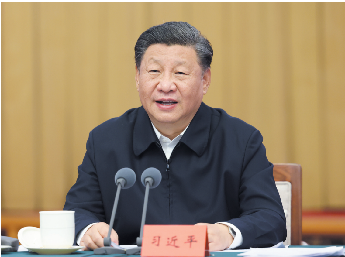
10月22日下午,习近平在山东省济南市主持召开深入推动黄河流域生态保护和高质量发展座谈会并发表重要讲话。