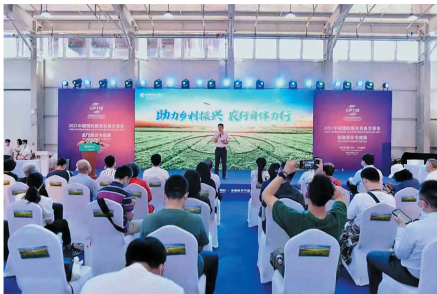
大力支持乡村振兴