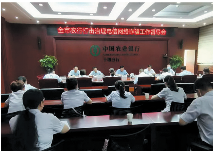
扎实推进反电诈工作