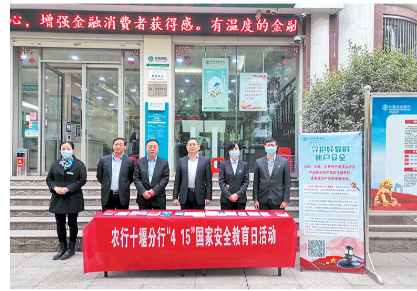
开展国家安全教育日活动