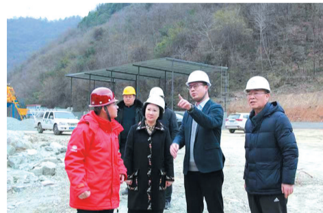
服务十堰中心城区水资源配置工程

为提高金融服务质效，交行十堰分行加强服务渠道建设，今年增设张湾支行，进一步完善区域布局，增强了服务力量，有效扩大金融服务半径。