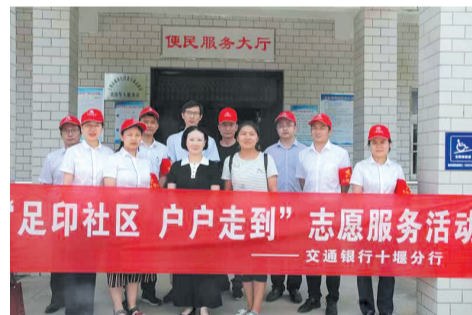
开展“足印社区，户户走到”志愿服务活动

普惠金融服务护航乡村振兴。2020年初，交行十堰分行了解到十堰市农业产业化龙头企业——某茶叶公司因季节性大量收购农户鲜叶，需要资金周转时，该行分管副行长、科长、客户经理立即前去调查了解，并快速响应客户需求，在一个月之内为客户获批400万元短期流动资金贷款额度，解决了客户在春季大量收购茶叶鲜叶的资金难题。2021年为进一步支持这一客户，助力乡村振兴，该行追加100万元授信给予金融支持。