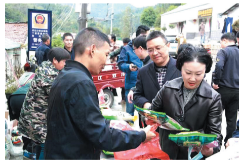
开展消费扶贫，支持产业发展