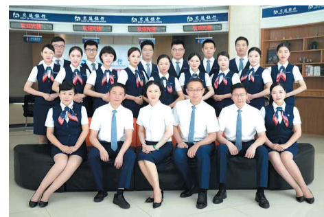
百佳服务网点创建团队

天地交而万物通，上下交而其志同。下一步，交行十堰分行将继续秉承“一个交行、一个客户”的服务理念，全面提升服务质量，确保为广大客户群体提供规范高效、优质满意的金融服务，切实履行国有大行的社会责任，为“经济倍增、跨越发展”提供源源不断的金融动能。