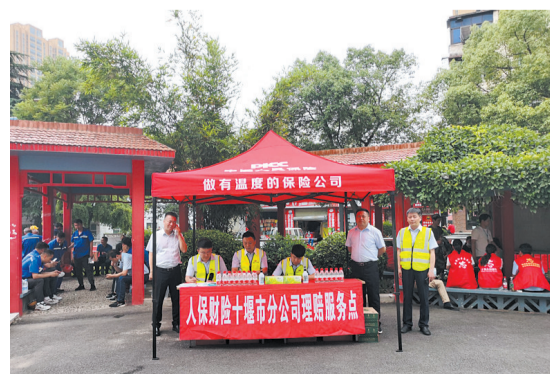
人保财险十堰分公司增设的理赔服务点