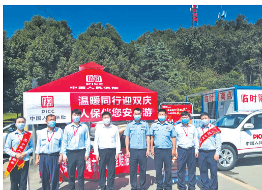
“温暖同行迎双庆 人保伴你安全游”活动现场