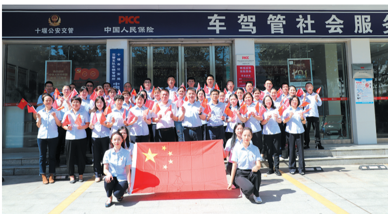
朝气蓬勃的人保财险员工队伍

坚守人民情怀,发挥行业优势,服务发展大局,温暖一城民心。长期以来,人保财险十堰市分公司积极履行金融央企责任,持续强化护航发展功能,不断凝聚诚信建设合力,以实际行动践行“做有温度的人民保险”理念,受到社会各界广泛认可。