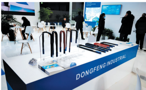
参加上海法兰克福汽配展