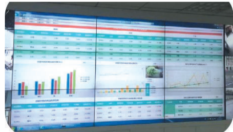
参建的湖北供销华西农产品动态监测系统