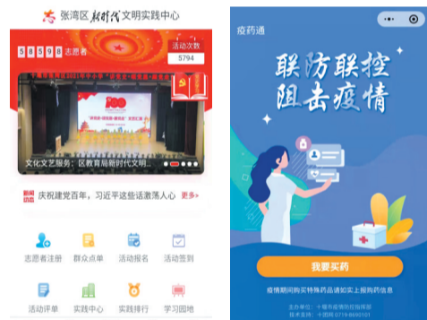
参建的各类信息管理平台

以“诚”“信”为双翼,下一步,湖北十团网络科技股份有限公司将继续担当“用数字技术为客户创造价值,做优秀的互联网服务提供商”的企业使命,组建十堰市软件和信息技术服务云研发中心,聚集产业资源,用更好的技术和创新精神,服务市、区“智慧十堰”“智能制造”建设,用网络技术为经济腾飞插上飞翔的翅膀,用数字服务践行新时代科技强国梦想。