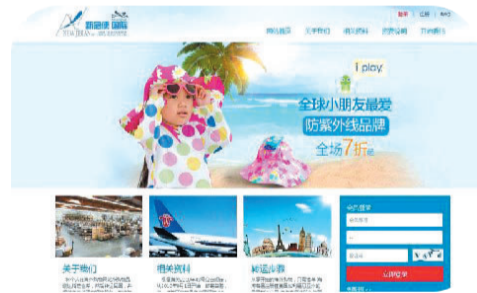
参建的上海新急便国际海外物流转运平台