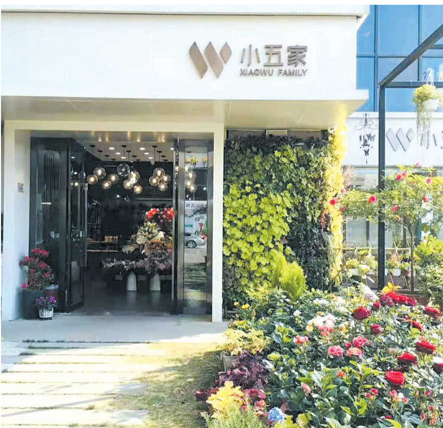
温馨浪漫的“小五家”栖谷天街店

“小五家”的前身是十堰鲜花行业的翘楚领军者小五家坊，23年来，“小五家”从十堰到武汉，从一家“夫妻店”发展到今天仅十堰事业部就拥有十堰市小五家坊、湖北小五家旅游开发有限公司、湖北正禾物业管理有限公司、湖北五境园林绿化工程有限公司、十堰市小五家餐饮管理有限公司和十堰国瑞酒店管理有限公司栖谷分公司6家公司的综合多业态现代服务企业，始终坚持诚信经营、品质服务，让生活之美伴随花香在消费者心中持久传递、一路芬芳。