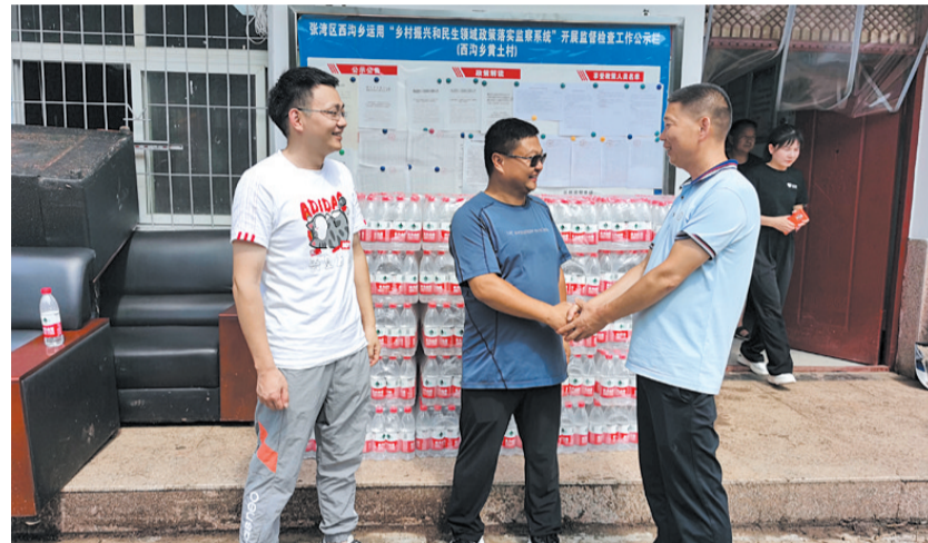
向张湾区西沟乡黄土村捐赠物资