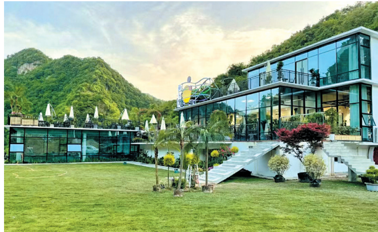
“小五家西沟花园”项目