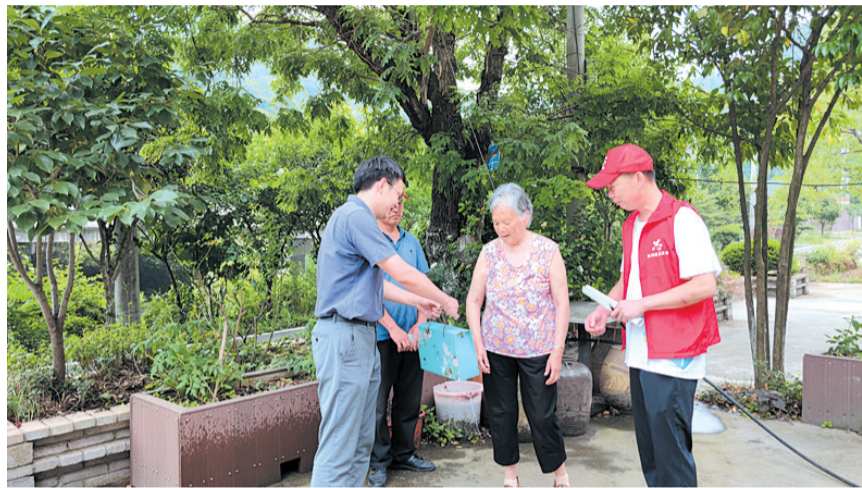
“小五家”志愿者向群众宣传创文知识