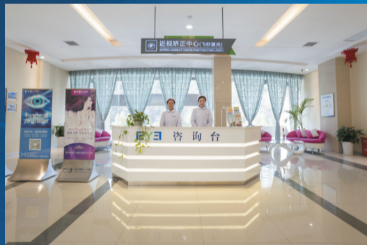
十堰爱尔眼科温馨的诊疗环境