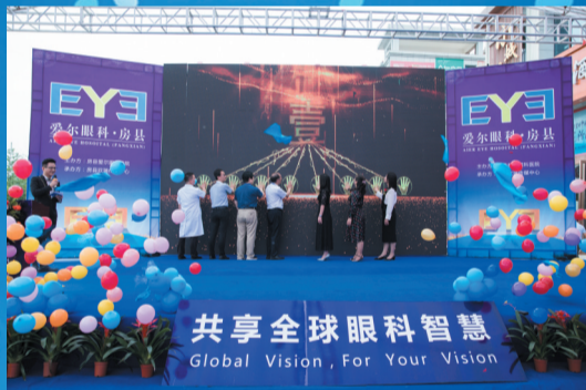
房县爱尔眼科医院盛装开业