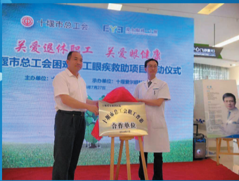
成为“健康扶贫 光明济困”项目合作执行医院