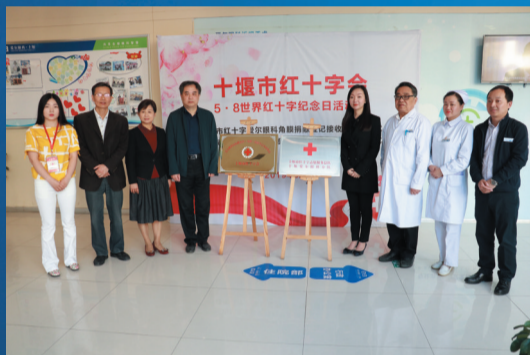
十堰市红十字志愿服务总队十堰爱尔眼科分队