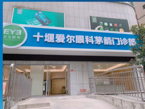
十堰爱尔眼科茅箭门诊部