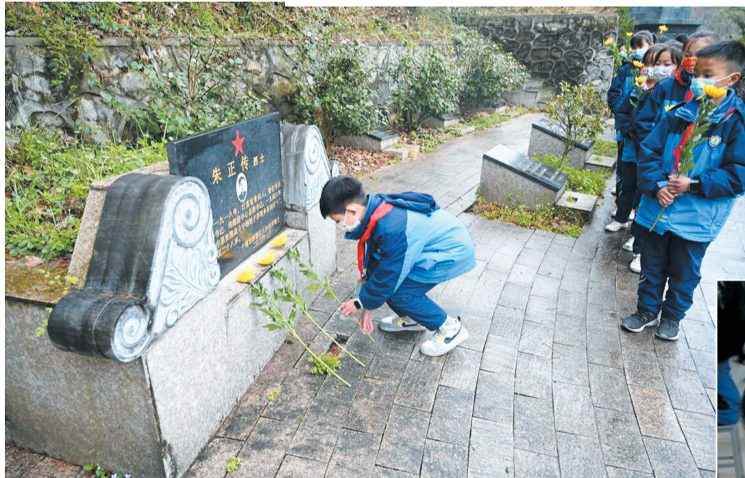
▼ 3月29日，茅箭区实验学校组织该校师生代表近 50 人，到茅箭区东沟烈士陵园开展悼念祭扫活动，向烈士敬献花篮以缅怀先烈，寄托哀思，激励斗志。