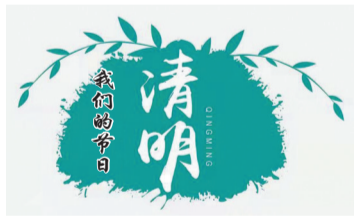
▲ 近日，竹溪县长安学校组织学生开展“网上祭英烈”活动，让学生缅怀革命先烈，珍惜现在幸福生活。