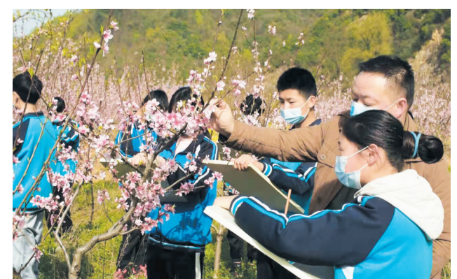
3月28日，郧阳区鲍峡中学组织该校八（7）班美术兴趣小组学生来到鲍峡镇西村观景桃园，开展写生活动。

康伟教授从“深刻认识理论名称”“全面领会理论内涵”“准确把握理论定位”等三个方面展开宣讲，图文并茂、深入浅出，既有对习近平新时代中国特色社会主义思想形成过程的系统回顾，也有对现实政治生活重大意义的深刻解读，使全体党员对习近平新时代中国特色社会主义思想有了更加全面的认识和更理解，也为学校发展注入了担当作为的精神动力。