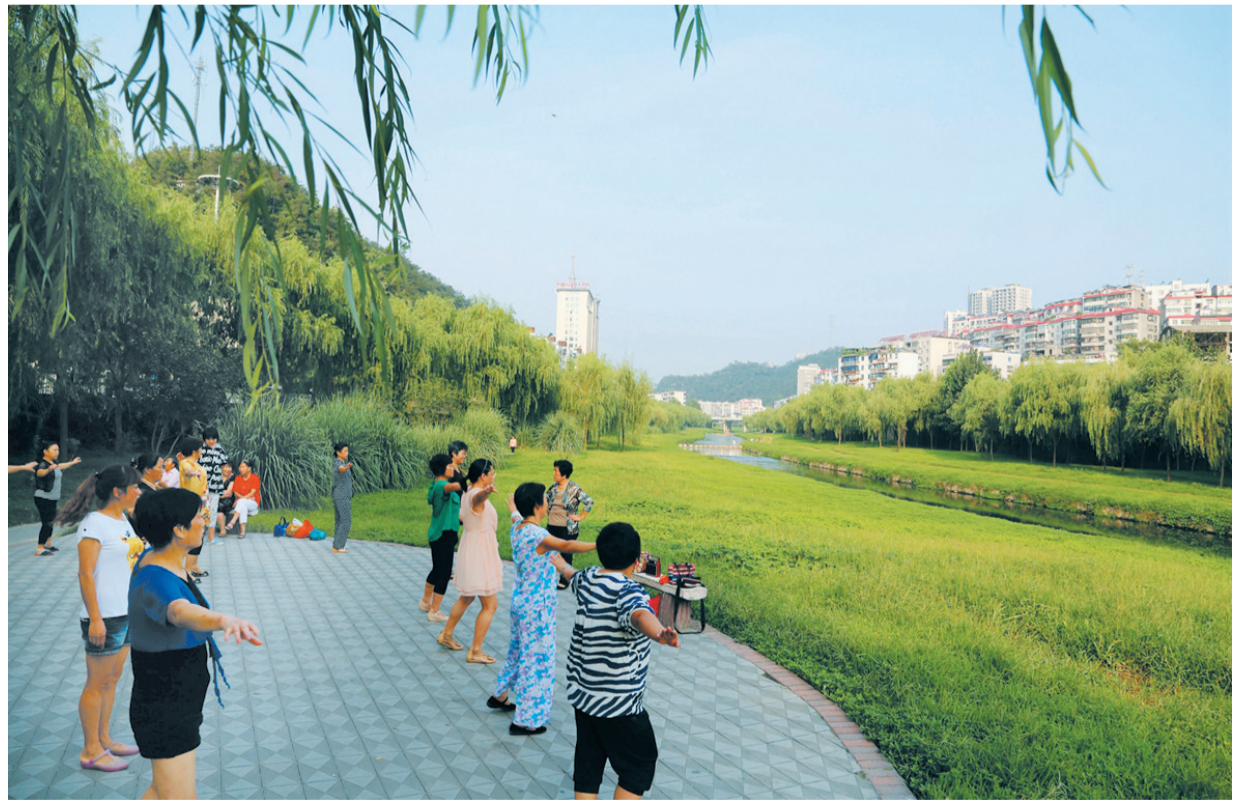
市民在风景如画的神定河畔休闲健身。