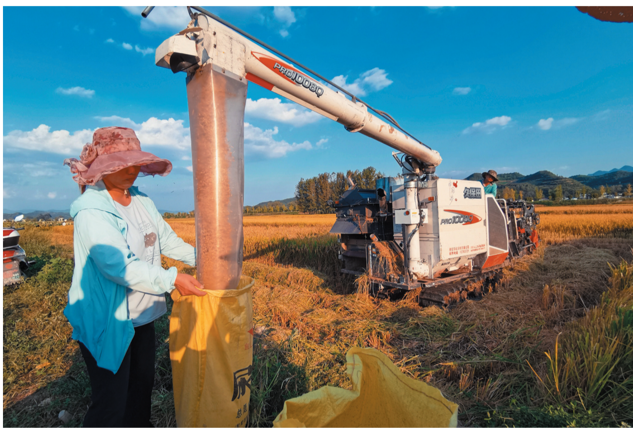
在房县军店镇下茅坪村,种植户利用联合收割机收割水稻。

党的十八大以来,我市深入学习贯彻习近平总书记关于“三农”工作的重要论述,不折不扣落实党中央、省委决策部署,全力守护群众的“米袋子”“菜篮子”,稳稳托起民生幸福。