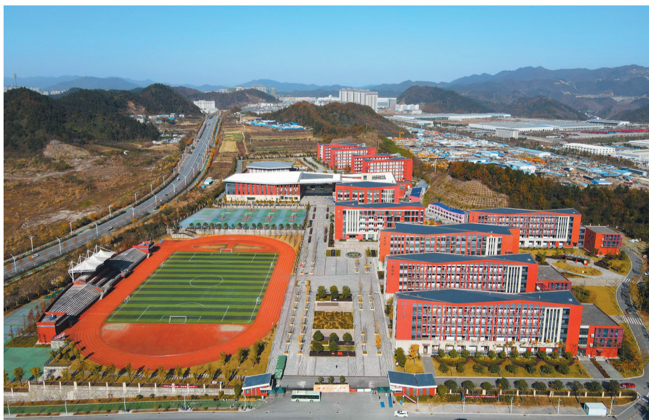
新建的柳林中学办学条件显著改善。

“孩子能够就近得到优质教育,真是太好了。”近日,北京路中学初一学生家长李女士高兴地说。