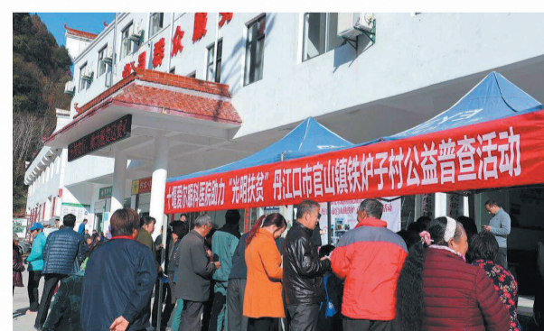
医院医务人员赴丹江口市官山镇开展眼病普查活动