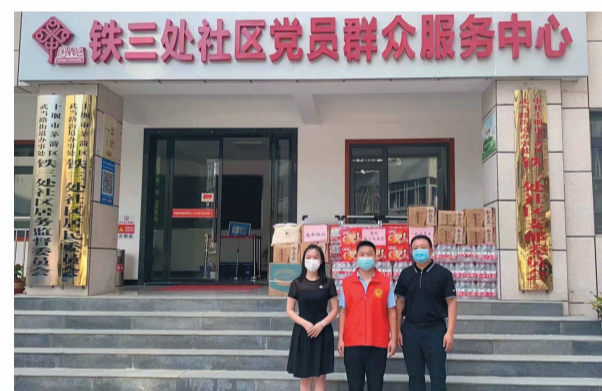
慰问一线防疫人员