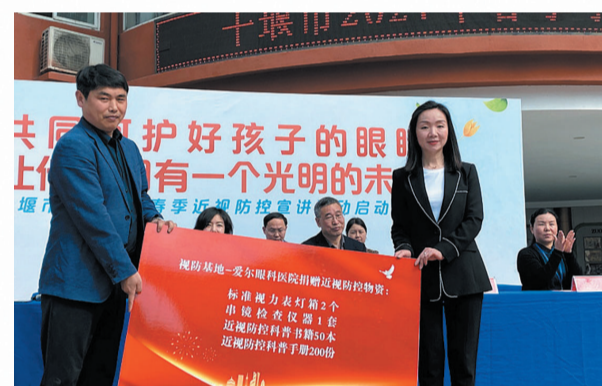
十堰爱尔眼科医院为学校捐赠近视防控物资

党建兴,则事业兴;党建强,则事业强。一个全院医务人员和员工向党员学习,积极向党组织靠拢的生动局面正在形成。