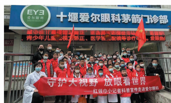
红领巾小记者科普宣传走进爱尔眼科