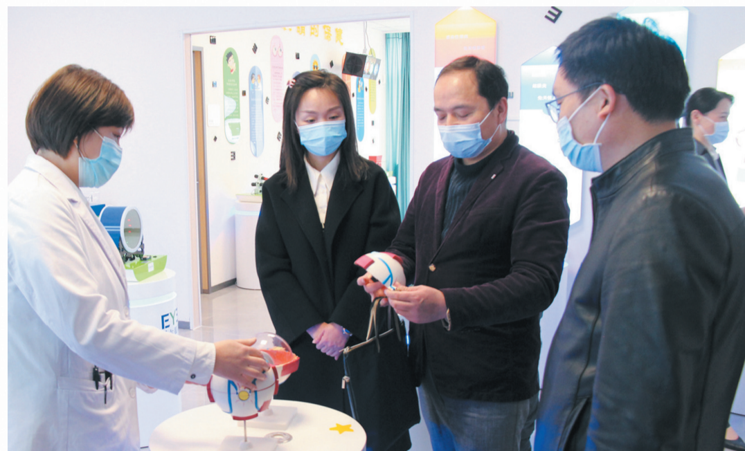
市教育局、市疾控中心调研组参观十堰爱尔眼科医院茅箭门诊部眼健康科普馆