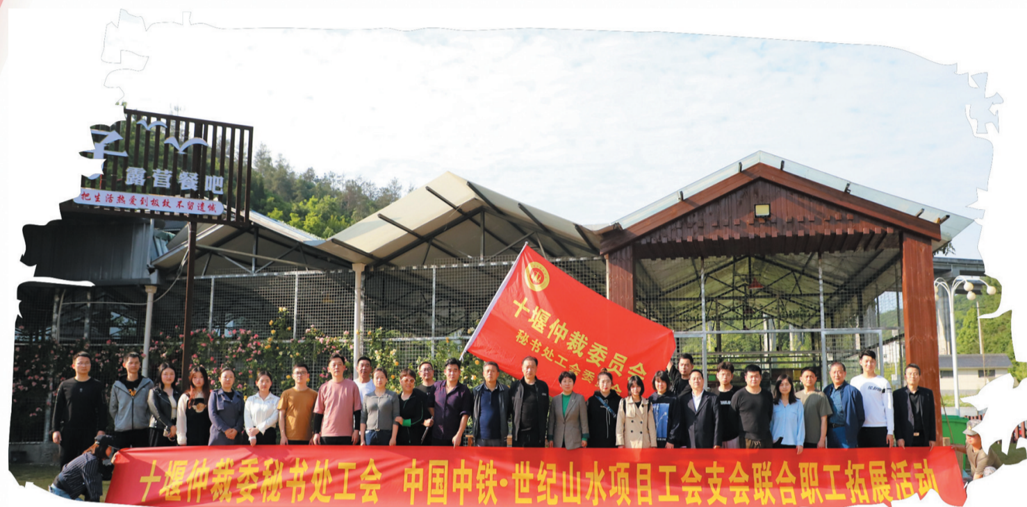
十堰仲裁委开展支部联合主题党日活动

实干实为，笃行不息。十堰仲裁委始终按照“完善仲裁制度，提高仲裁公信力”的要求，以打造一流仲裁机构、建设鄂西省域区域仲裁中心为目标，紧盯全市中心工作和经济社会发展需要，大力发挥仲裁优势，为守护地方法治公平正义、优化法治化营商环境、推动高质量跨越式发展作出了积极贡献。