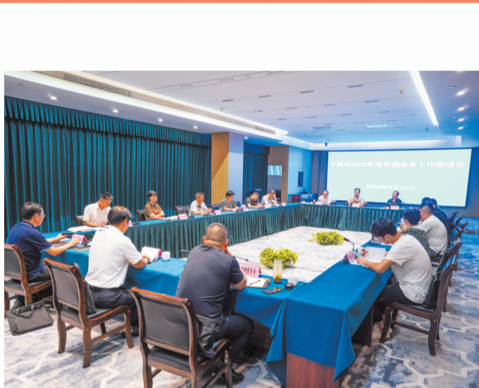
十堰市2022年度仲裁业务工作推进会现场

高效展现担当。截至2022年9月，十堰仲裁委驻市中级人民法院人民调解委员会共接待案件当事人1200人次，成功调解民事纠纷830余件，处理争议标的的约1.3亿元，减免仲裁费约150余万元。