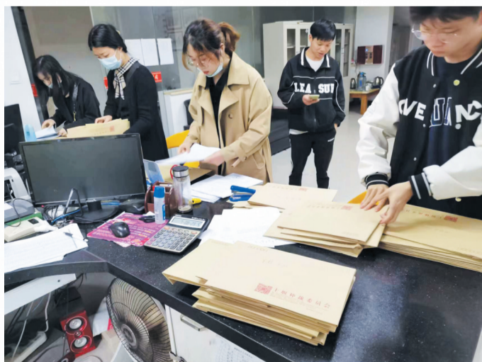
十堰仲裁委办案人员送达物业纠纷案件

将触角延伸到基层一线，打通仲裁服务“最后一公里”；大力开展“送法进企”活动，为企业发展当好“法参谋”；积极参与全市金融风险防范化解工作，帮助金融机构打好“预防针”、提高“免疫力”……民生无小事，仲裁有温度。在追求自身高质量发展的同时，十堰仲裁委积极拓宽仲裁服务渠道，将服务阵地向乡村振兴、基层治理一线前移，以实际行动树立良好形象、擦亮服务品牌。