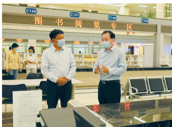
市司法局局长张树群(左)察看仲裁委便民服务窗口