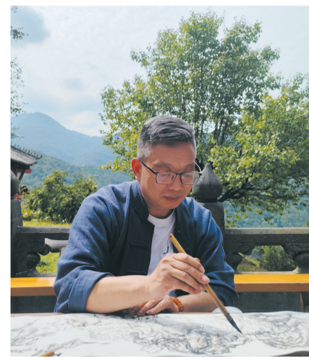
陈海潮绘《太子坡全景图》

一里四道门、九曲黄河墙、一柱十二梁、十里桂花香……9月23日，秋分，《武当雅集》首季第八集“复真悟本”活动在武当山太子坡景区精彩上演。