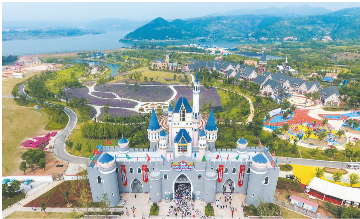
子胥湖欢乐嘉年华(资料图片)