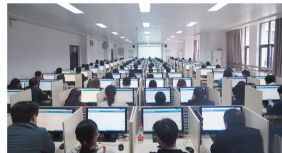
国家医保信息平台(十堰)正式启动运行