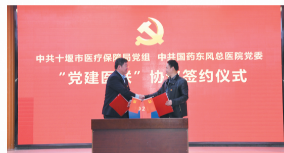
与国药东风总医院举行“党建医联”签约仪式

——加强医保基金监管，做实应管尽管。在全市范围内开展打击欺诈骗保行动，切实维护医保基金安全。重点打击医疗机构虚假票据、串换项目、伪造病情等行为，扎实开展“假病人、假票据、假病情”、骨科高值耗材、口腔专科门诊等专项整治行动，牵头建立起公安、卫健、市场监管等部门联合执法机制，灵活运用智能监控、数据分析等信息化手段加强基金监管。同时，扎实开展宣传月活动，通过召开新闻发布会、制作展板横幅、发放宣传资料、群发短信、参与监管知识有奖答题等，在全市掀起了打击欺诈骗保行为的舆论热潮。今年上半年，现场检查定点医疗机构1043家，处理定点医药机构186家，在全市形成了“不敢骗、不想骗、不能骗”的基金监管高压态势。