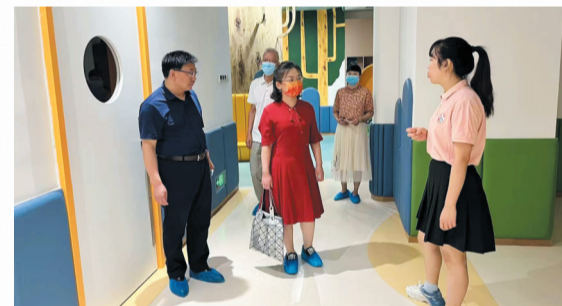
市医保局工作人员在市妇幼保健院调研

——医保放管服改革推动有力。针对医保办事“难点、堵点、痛点”，持续推进医保领域“优化营商环境”和“放管服”改革工作。其中今年上半年取消申请医保定点许可证等4项材料，对职工医保县域内就医、职工医保二次补偿等5项业务流程进行简化，办理时限较之前整体压缩比例超70%，最长服务办理时限控制在20个工作日。积极推进转外就医、异地安置等28项业务的“网上办”“掌上办”，把推进“网上办”“掌上办”和“好差评”作为提高服务体验的有力抓手。门诊慢病实现“即时申报”、生育保险实现“免审即享”、医保支付实现“扫码结算”，全市医保经办服务质量和效率实现“双提升”，医保窗口获得2022年上半年政务服务大厅“红旗窗口”称号。