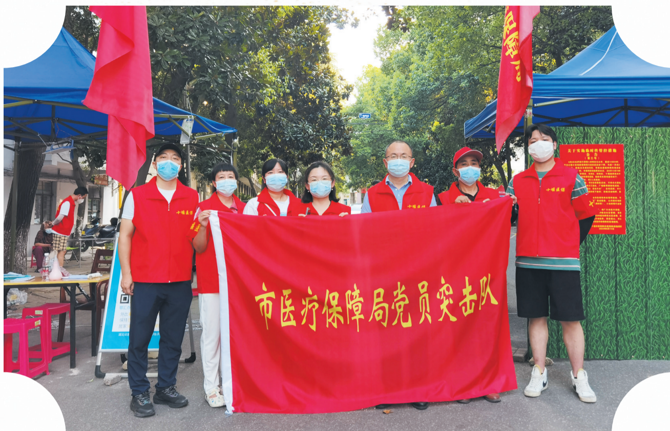
市医保局党员突击队下沉社区一线抗疫

“病有所医”，这是百姓的基本心愿，也是政府的民生承诺。在十堰高质量跨越式发展征程中，我市坚持把医疗保障作为事关人民群众健康福祉的重大民生工程来抓，努力构建多层次、宽领域、全覆盖的医疗保障体系网，着力保障全市人民医疗需求，让参保群众获得感、幸福感、安全感不断增强。全市医保工作规范有序，基金运行水平、医保脱贫攻坚、城乡居民市级统筹、医保战疫、支付方式改革、医保法治化建设等均走在全省前列。