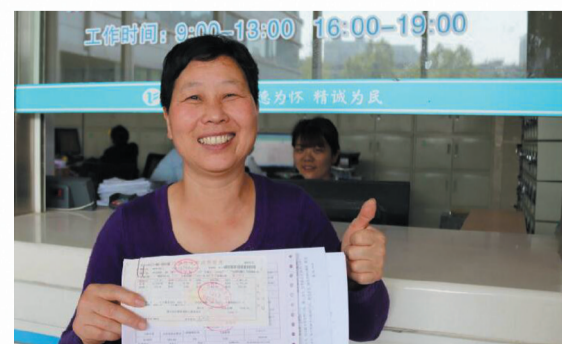
精准帮扶 医疗救助