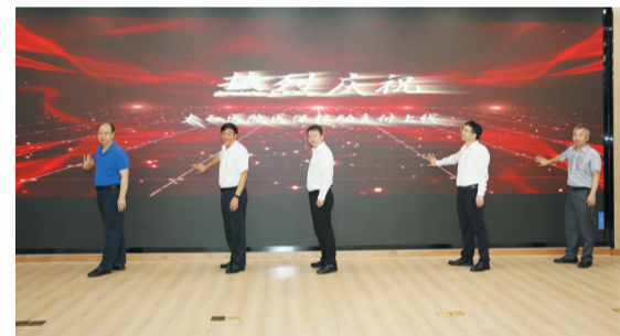
在太和医院举行医保移动支付上线仪式