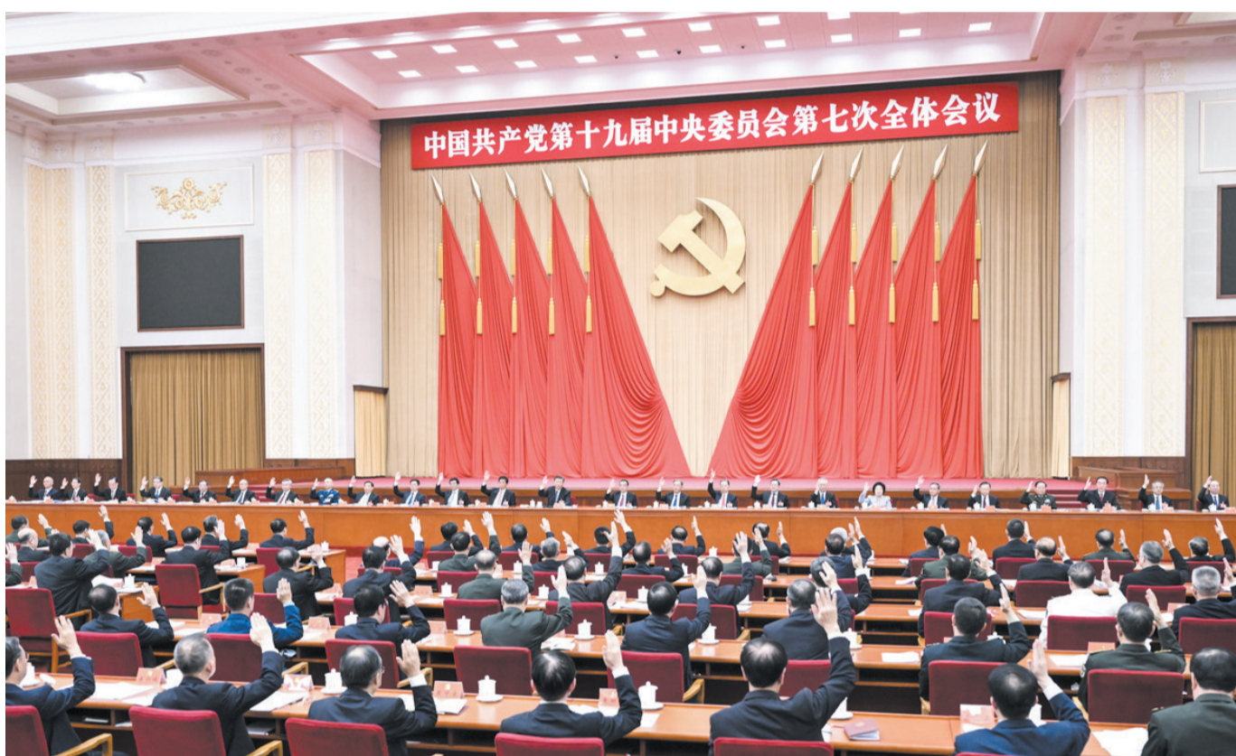
中国共产党第十九届中央委员会第七次全体会议在北京举行。(据新华社)