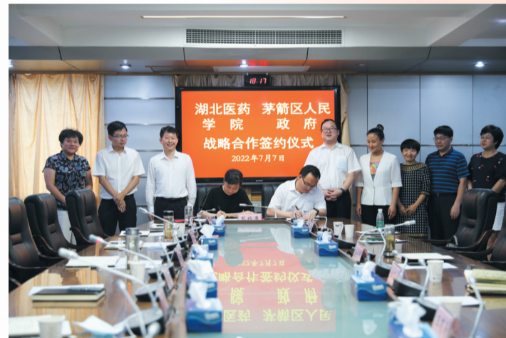
茅箭区与湖北医药学院深化校地合作

性引进北京院士、专家等一大批高端人才。通过创新打造“企业董事长、总经理进校园进班级”定点靶向招聘活动，在湖北工业职业技术学院智能工程学院、机电工程学院两个分院点对点举办招才见面会，吸引两个分院近350名学生参加。此外，开展“春风行动”“大学生留(回)堰专场招聘”“赴外地招才引智”、人社惠民惠企政策宣传暨“人才夜市”等系列招聘活动31场。结合高校专业优势，在湖北医药学院、湖北汽车工业学院举行“医药产业+人才”“汽车产业+人才”专场招聘，搭建针对性、差异化招才平台，共计吸引116家相关企业参与，提供优质岗位1840个，达成就业意向353人。