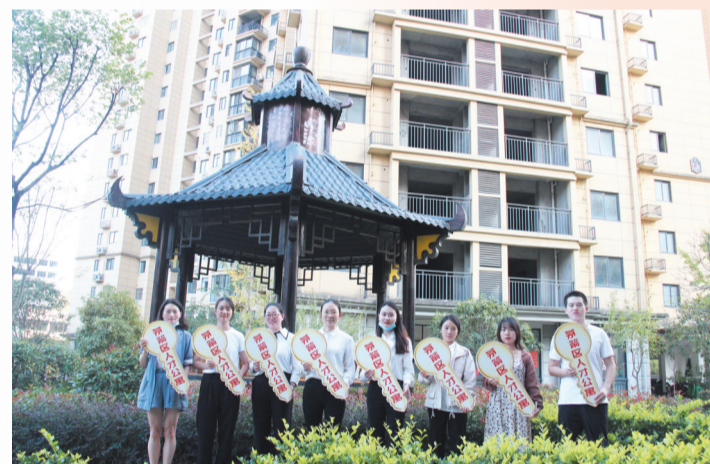
茅箭区首批24名高层次人才领取人才公寓钥匙

为全面激发企业创新、人才创业活力，茅箭区全面发挥资金扶持作用。其中，为8名大学生发放创业全额贴息贷款244万元，为2名退役军人发放全额贴息贷款40万元，为21名45岁以下青年创业人才发放贷款420万元，发放大学生一次性创业补贴及场租补贴2.94万元，为青年人才创业提供了充足资金保障。