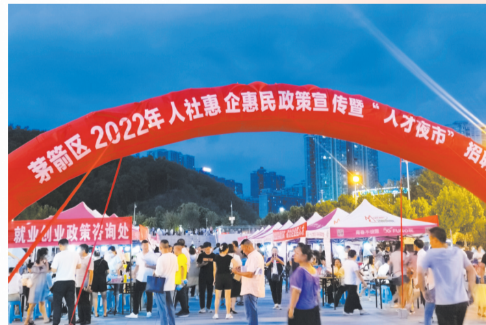
开展惠企惠民政策宣传

坚持招商引资与招才引智并举，依托京津冀、长三角、珠三角、川渝等驻外招商工作站设立人才工作站，建立“八大产业链”招商引才机制，考察项目、引留人才，先后通过清华大学新材料研究中心、中国工程院黄瑞松院士团队、武汉大学化学研究院、上海消防研究所等团队引进陶瓷基板、激光陀螺仪、高分子医用新材料、应急装备检测等30余个招商项目，吸纳专业技术人才50余名。