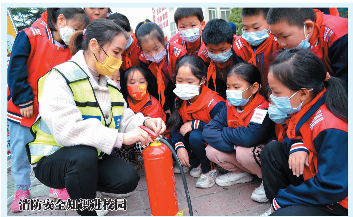
消防安全知识进校园