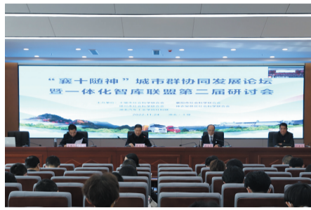
切实可行的对策建议，为“襄十随神”协同高质量发展提供智力支撑。

此次会议是“襄十随神”智库联盟成立以来首次通过线上+线下方式召开的会议。会议紧扣党的二十大精神和省十二次党代会安排，联系各地实际，对如何推进绿色低碳发展进行深入研讨交流，提出