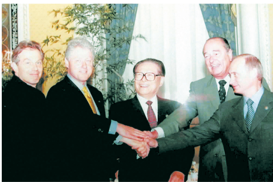
左图：2000年9月7日，由联合国倡议的联合国安理会五个常任理事国首脑会议在纽约举行。江泽民同志（中）同法国总统希拉克（右二）、俄罗斯总统普京（右一）、英国首相布莱尔（左一）、美国总统克林顿（左二）握手合影。