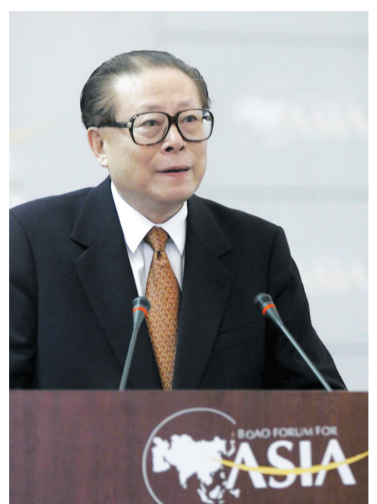
上图：2001年2月27日，博鳌亚洲论坛成立大会在海南举行。江泽民同志出席成立大会并致辞。