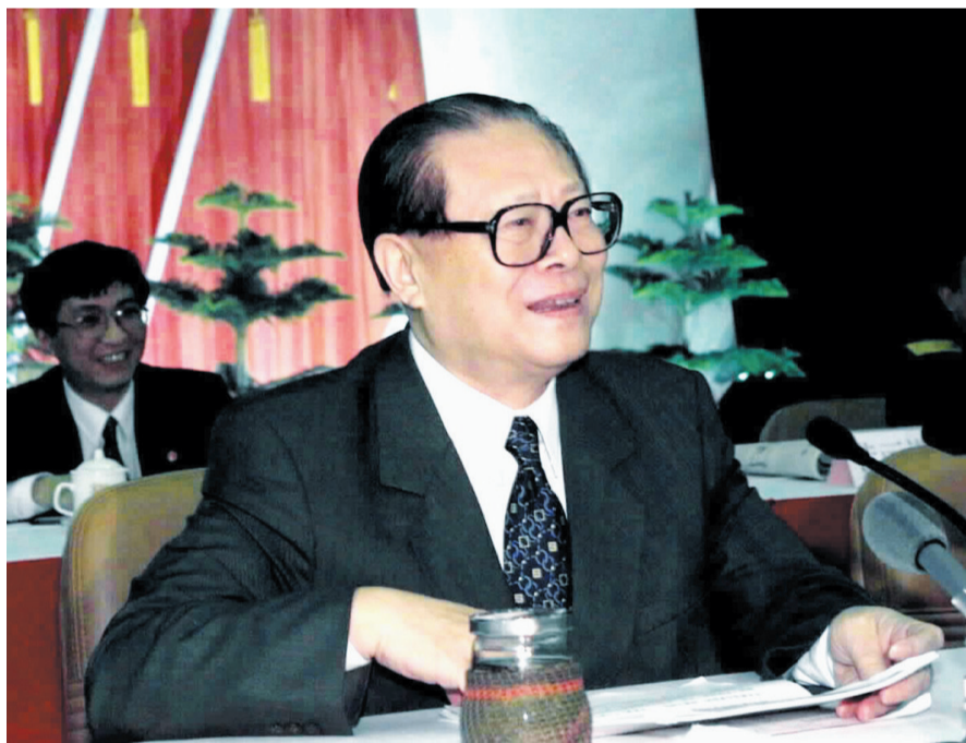
上图：2000年2月20日，江泽民同志在广东省高州市领导干部“三讲”教育会议上发表重要讲话。在这次广东考察中，江泽民同志提出，我们党总是代表着中国先进生产力的发展要求，代表着中国先进文化的前进方向，代表着中国最广大人民的根本利益。