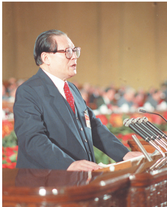
左图：1992年10月12日，中国共产党第十四次全国代表大会在北京人民大会堂开幕。这是江泽民同志代表第十三届中央委员会作报告。