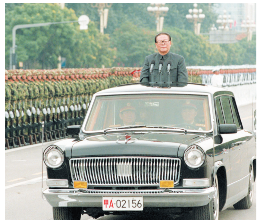
左图：一九九九年十月一日，中华人民共和国成立五十周年盛大庆典在北京天安门广场举行。江泽民同志检阅由人民解放军陆军航空三军和人民武装警察部队、民兵预备役部队组成的地面方阵。