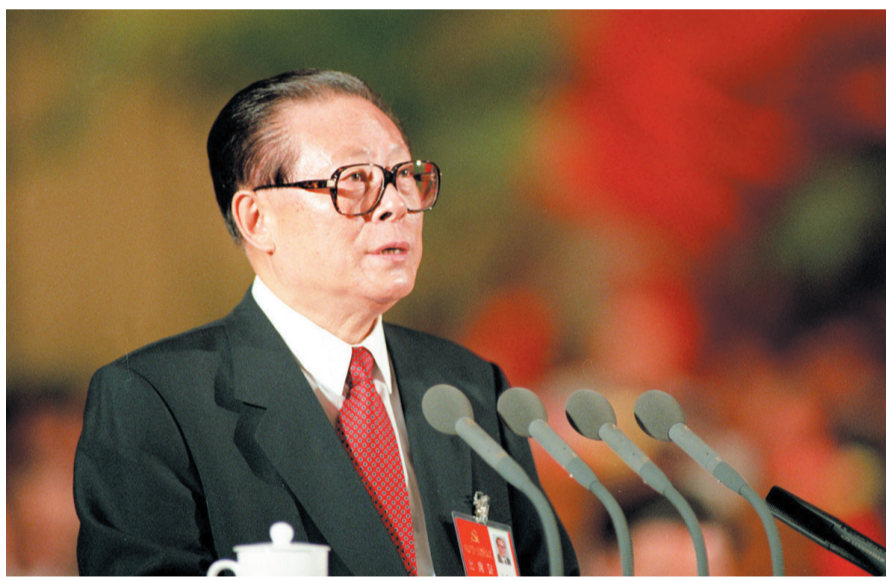
上图：1997年9月12日，中国共产党第十五次全国代表大会在北京人民大会堂开幕。这是江泽民同志代表第十四届中央委员会作报告。