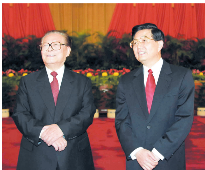
左图：2002年11月15日，江泽民同志、胡锦涛同志在北京人民大会堂亲切会见出席党的十六大代表、特邀代表和列席人员并发表重要讲话。