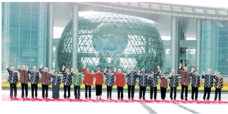
左图：2001年10月21日，亚太经合组织第九次领导人非正式会议在上海举行。这是江泽民同志与参会的经济体领导人合影。