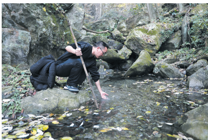
记者探寻位于武当山琼台的剑河上游水源。(2022年11月7日摄)

剑河发源于武当山天柱峰，流经紫霄宫、太子坡、财神庙、王家院、老君堂、武当山镇，贯穿武当山景区和武当山城区，在香炉院汇入汉江，流域面积47.2平方公里，主河道长26.5公里。