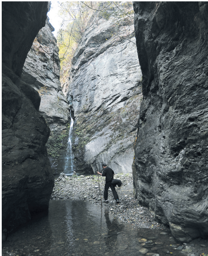
位于剑河中上游的峡谷瀑布。(2022年11月7日摄)

武当山天柱峰，海拔1612米，又称金顶，鹤立于重峦叠嶂之中，如利剑直插云霄，气势宏大，有“一柱擎天”之誉；环绕其周围的七十二峰，峰峰拔地刺天，俯首相向；三十六崖、二十四洞、十一涧、九泉、三潭等名胜点缀其间，渊谷幽深，飞瀑流泉。