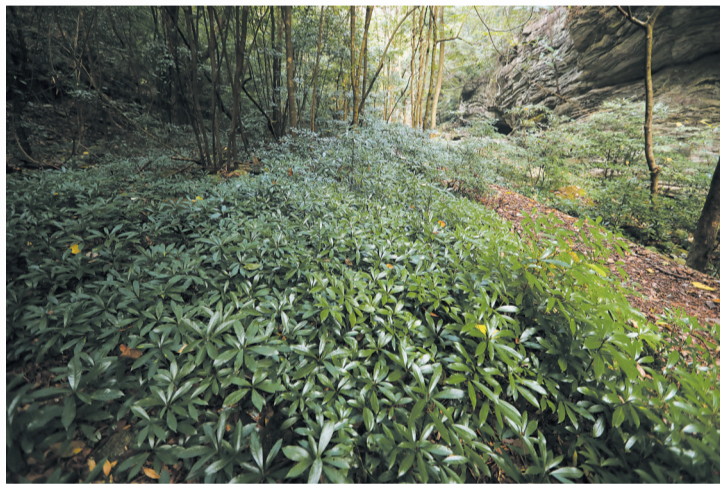
剑河中游河谷段生发连片的野生“黑虎楠”幼苗。(2022年11月7日摄)