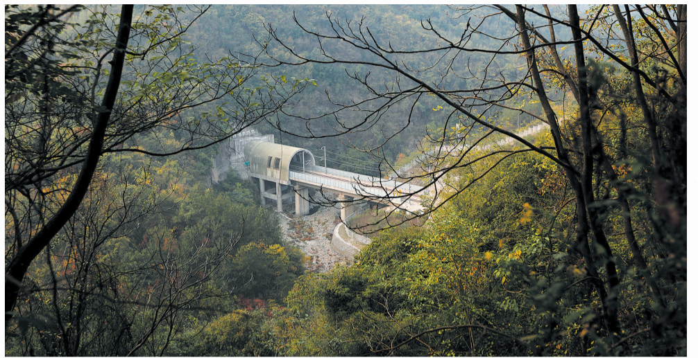
从剑河水库下游跨过剑河的汉十高铁铁路。(2022年11月7日摄)

1931年5月，贺龙率红三军由荆门北上，智取谷城石花街、火攻均州城后，率部进驻武当山