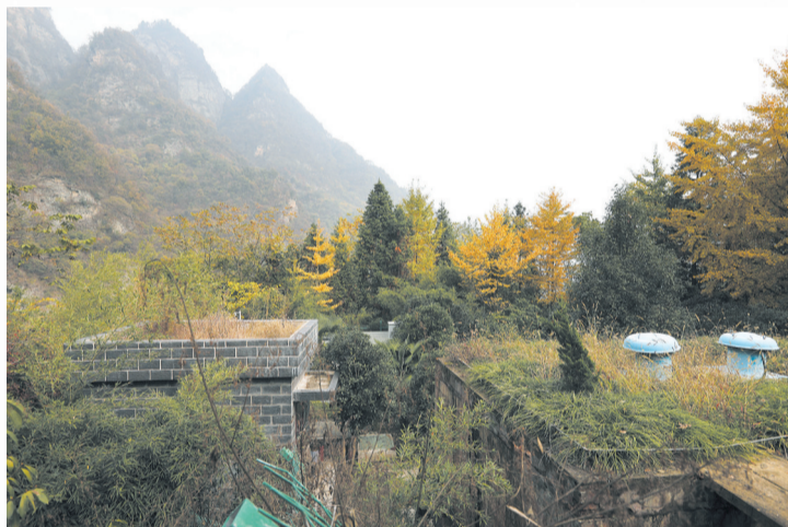
位于琼台下方掩映在密林中的污水处理厂。(2022年11月7日摄)