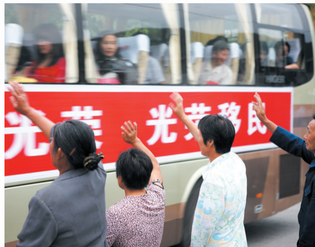
村民挥手送别库区外迁移民(2010年6月19日摄)

本报 记者毛以国报道：“在家中，我会利用自己身为纪检监察干部的优势，时常为丈夫上一堂‘廉政党课’，提醒他不要辜负组织的信任，在工作岗位上坚守法律底线，抵御各种诱惑，做一名清正廉洁的好干部。”近日，在茅箭区“家庭助廉”座谈会上，一名纪检监察干部分享的的心得体会引发与会领导干部家属强烈共鸣。