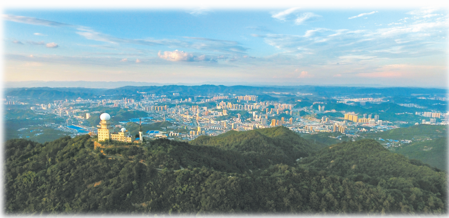
十堰城市全景(2016年7月12日摄)