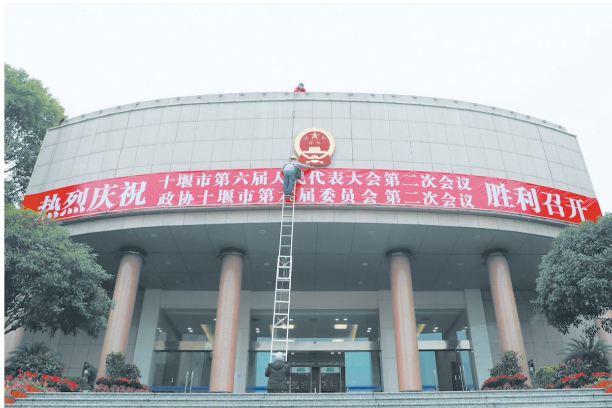
“两会”召开前，工作人员悬挂横幅

同心向党赴盛会，奋楫扬帆启新程。代表委员们一致表示，将不负重托、不辱使命，认真履行职责，积极传递民声，以高度的政治责任感和使命感，为建设绿色低碳发展示范区作出积极贡献。