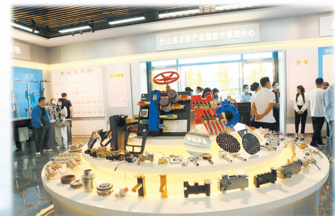
卫浴产业园产品展示大厅