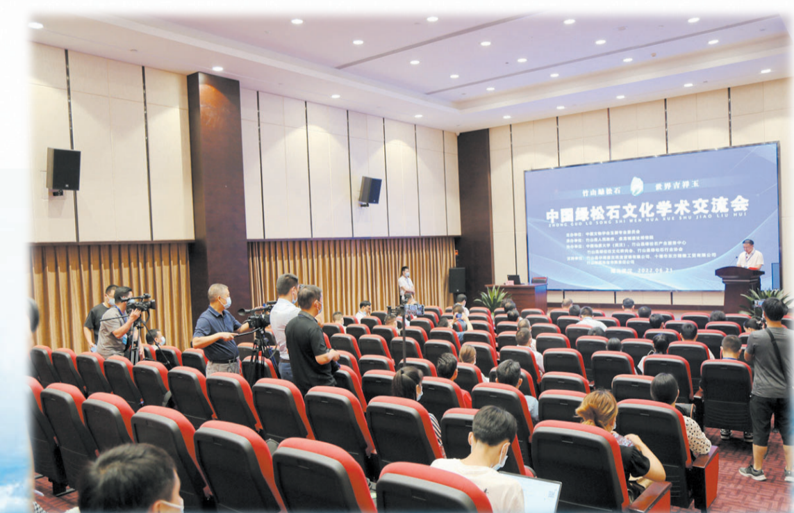
中国绿松石文化学术交流会